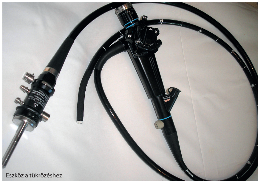
Eszköz a tükrözéshez

A gyomorégés, savas regurgitáció, felbőfögés annyira jellegzetes tünetek, hogy meglétük esetén fiatal egyéneknél akár el is kerülhetnek a diagnosztikus vizsgálatok. Ezt tekintjük tüneteken alapuló diagnosztikának. Típusos tünetek esetén a diagnózist megerősítheti a savtermelést gátló gyógyszeres kezelés alkalmazásával elérhető tünetmentesség. Az ún. proton-pumpa gátló (PPI) terápiás teszt során a PPI adására bekövetkező kedvező klinikai válasz esetén valószínűsíthető a GERD. Ha a PPI-terápiás teszt ellenére változatlanok maradnak a panaszok, endoszkópos kivizsgálás szükséges. Megfelelő gyógyszeres kezelés hatására nem reagáló vagy alarm tünetek esetén, valamint idős betegekben újonnan jelentkező refluxos tünetek esetén a nyelőcső-gyomortükrözés (endoszkópia) elvégzése feltétlenül szükséges.